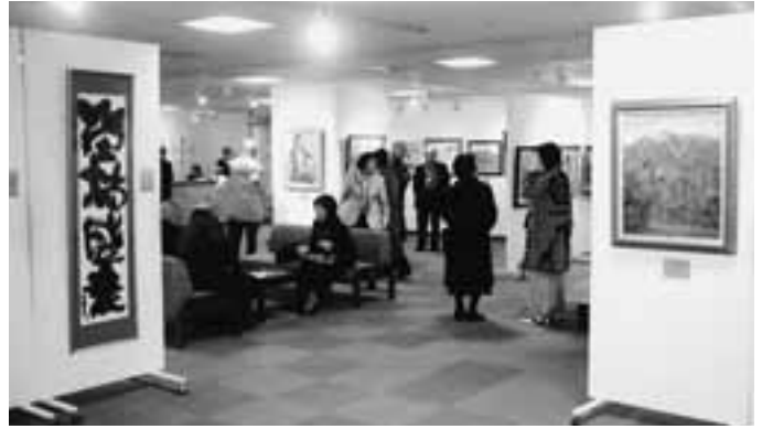
第13回美術展開催風景