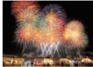
市制40周年花火大会