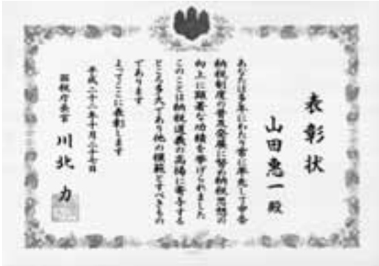
国税庁長官表彰状