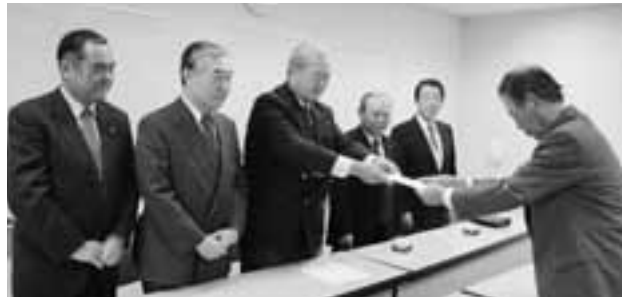
鴻巣支部・吹上支部