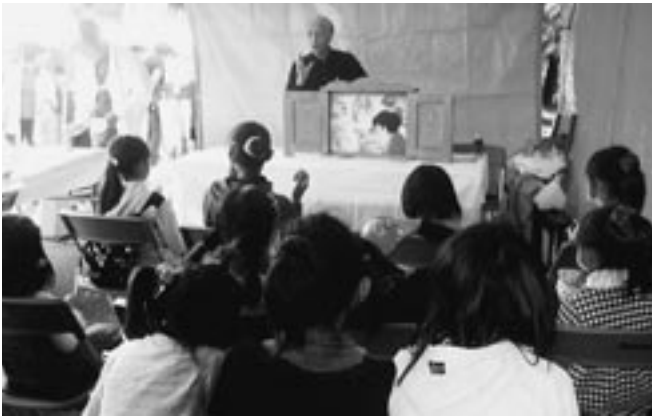
上尾祭りにおいて租税教育の一環として、全法連作成の紙芝居「児童のいたずら」を公演