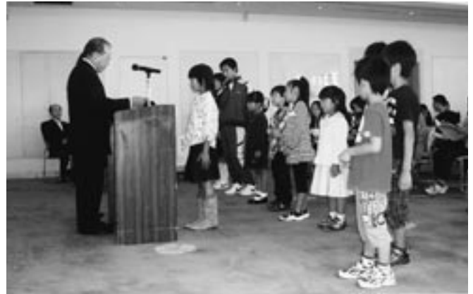
小・中学生を対象に「北本ふれあい家族の日」と題した、標語・作文・絵・写真部門の家族のふれあいをテーマとした主催事業