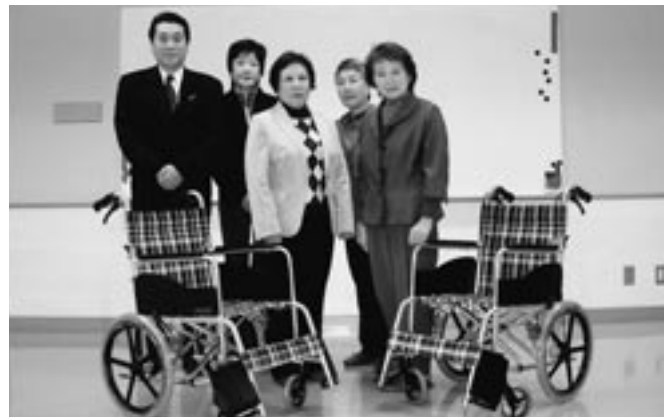
伊奈支部女性部会では商工フェアにおいてバザー並びに募金活動を行い、伊奈町社会福祉協議会に車椅子2台を寄贈