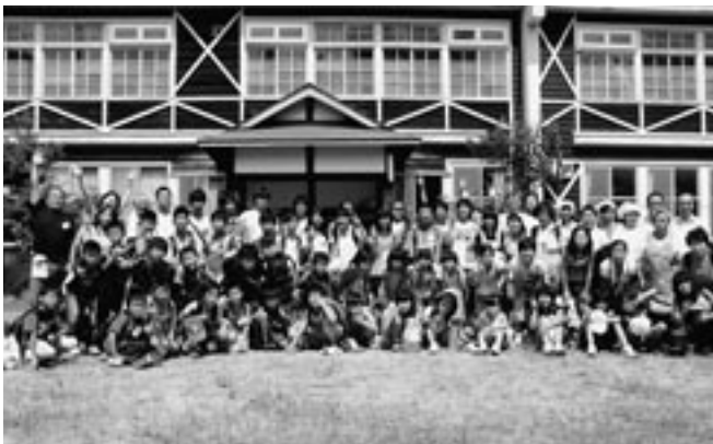
野外活動を通じて子どもたちの大自然とのふれあいをテーマに「子ども自然教室サマーキャンプ」への共催参加者が一同に会したキャンプ風景